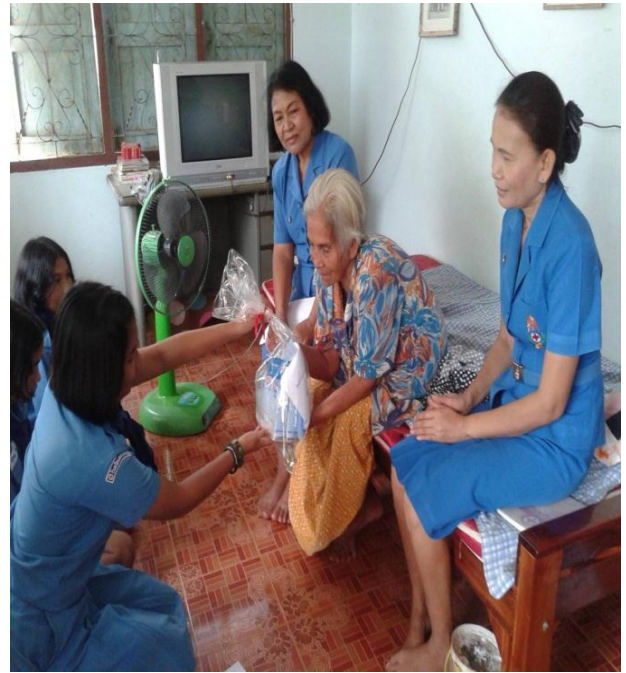
สมาชิกยุวกาชาดสอบถามชีวิตความเป็นอยู่ของผู้สูงอายุ พร้อมมอบสิ่งของเป็นกำลังใจ